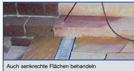
Auch senkrechte Flächen behandeln