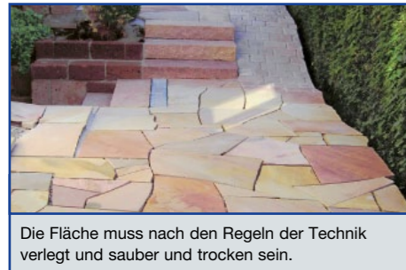
Die Fläche muss nach den Regeln der Technik verlegt und sauber und trocken sein.