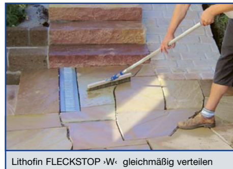
Lithofin FLECKSTOP ›W‹ gleichmäßig verteilen