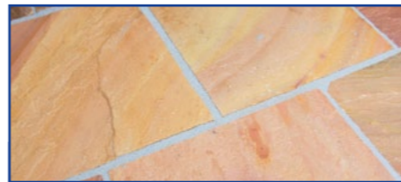
Die frisch verfugte Fläche wird zeitsparend gereinigt – sie zeigt sich klar und sauber.