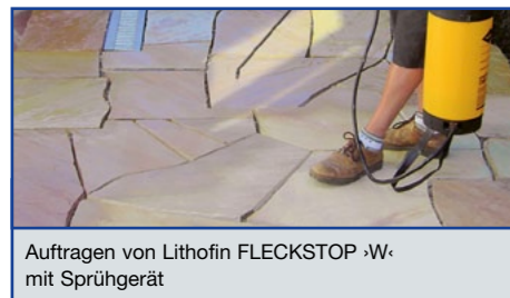
Auftragen von Lithofin FLECKSTOP ›W‹ mit Sprühgerät