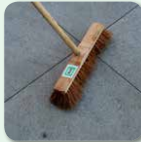
... und feuchtem Besen abreinigen