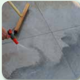
mit Wassersprühstrahl ...