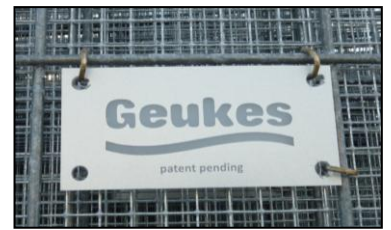
Gabionen Splitt-Korb exklusiv bei Geukes